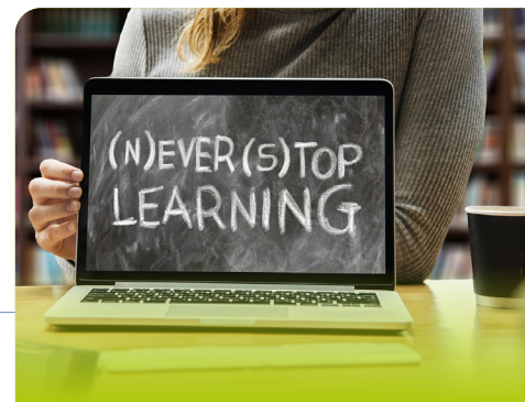
"N'arrêtez jamais d'apprendre."

Nous prions que le Seigneur continue de les qualifier et rende leur travail fructueux auprès de tous ceux qui souhaitent transmettre le message de la Bonne Nouvelle aux enfants.